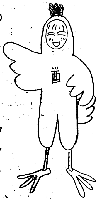
正月早々かぶりもの